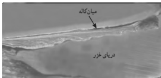
زبانه ماسه‌ای - شبه جزیره میان کاله در جنوب شرقی دریای خزر

اشکال فرسایشی تراکمی (ناشی از رسوب‌گذاری مواد) پدید می‌آیند. آب سنگ‌ها و جزایر مرجانی، باتلاق‌ها و زبانه یا دماغه ماسه‌ای از جمله این اشکال هستند. در جنوب شرقی دریای خزر شبه جزیره میان کاله زبانه ماسه‌ای وجود دارد.